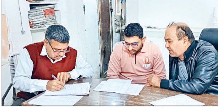
गोहाणा। छापेमारी के बाद रिपोर्ट तैयार करते सीएम फ्लाइंग के अधिकारी।

निरीक्षण के बाद रिपोर्ट तैयार कर सिंचाई विभाग के मुख्यालय भेजी, कार्रवाई की तैयारी