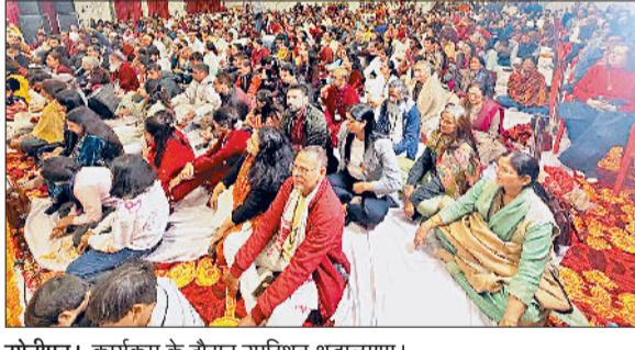
सोनीपत। कार्यक्रम के दौरान उपस्थित श्रद्धालुगण।