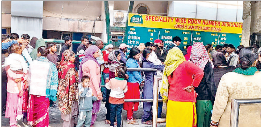
सोनीपत। नागरिक अस्पताल के बाहर काउंटर पर मरीजों की भीड़।

इस हड़ताल के कारण पिछले चार दिनों से अस्पताल में आवश्यक स्वास्थ्य सेवाओं पर गहरा असर पड़ा था, लेकिन अब स्थिति सामान्य होने लगी है। लंबित सर्जरी और जांच कार्य भी तेजी से शुरू हो गए हैं। शुक्रवार को अकेले जिला अस्पताल में 16 नेत्र ऑपरेशन सफलतापूर्वक किए गए और 30 से अधिक अल्ट्रासाउंड जांचें पूरी की जा सकीं। हरियाणा सिविल मेडिकल सर्विसेज एसोसिएशन के बैनर तले सरकारी चिकित्सकों द्वारा की गई यह हड़ताल मरीजों के लिए बीते चार दिनों तक परेशानी का सबब बनी रही। अस्पताल प्रशासन को बाल रोग, नेत्र रोग, स्त्री रोग और प्रसूति विभाग को छोड़कर अन्य ओपीडी सेवाओं को ईएसआई, एनएचएस और बीएमएस चिकित्सकों के सहारे चलाया पड़ रहा था। सीमित स्टाफ के कारण मरीजों को लंबी लाइनों में खड़े रहने और समय पर इलाज न मिलने जैसी समस्याओं का सामना करना पड़ा।