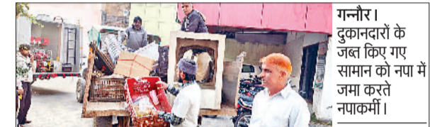
गन्नौर। दुकानदारों के जब किए गए सामान को नपा में जमा करते नपाकर्मी।