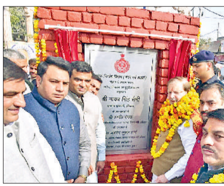
गोहाणा। परियोजना का शुभारंभ करते हुए मंत्री डॉ. अरविंद शर्मा।

में 18 करोड़ रुपए की राशि से 18 सड़कों का निर्माण करवाया गया है, जबकि 16 सड़कों का निर्माण जारी है। यही नहीं स्पेशल रिपेयर योजना में आगले छह महीने में 6 करोड़ रुपए की लागत से 9 सड़कों का निर्माण