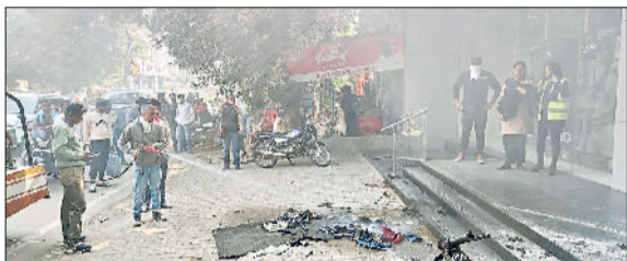
सोनीपत। जिन कपड़ों में आग लगी थी, उन्हें बुझाते हुए दमकल कर्मी।