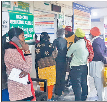
हरिभूमि न्यूज सोनीपत

हरियाणा सिविल मेडिकल सर्विसेज एसोसिएशन के आह्वान पर चार दिन तक चली चिकित्सकों की लंबी हड़ताल शुक्रवार को समाप्त होने के बाद जिला अस्पताल समेत राज्य के सभी सरकारी अस्पतालों में स्वास्थ्य सेवाएं पूरी तरह पटरी पर लौट आईं। हड़ताल खत्म होने की सूचना मिलते ही जिला अस्पताल में मरीजों का हजूम उमड़ पड़ा, जिसके चलते ओपीडी में सामान्य दिनों की तुलना में भारी वृद्धि दर्ज की गई और 1600 से अधिक मरीज उपचार के लिए पहुंचे।