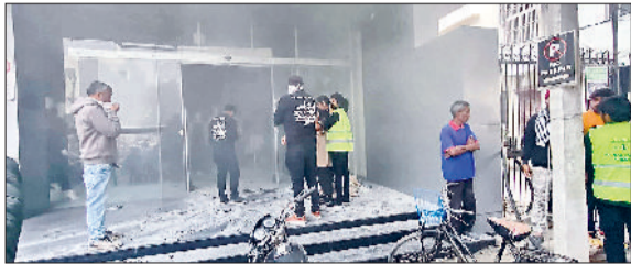
सोनीपत। कपड़ों के शोरूम से निकलता धुआं।

अलार्म बजते ही शोरूम में भगदड़ जैसी स्थिति बन गई। लोग नीचे उतरने के लिए सीढ़ियों और निकाल दरारों की ओर दौड़ने लगे। हालांकि कर्मचारियों ने इस दौरान पूरी सतर्कता के साथ लोगों को सुरक्षित दिशा में मार्गदर्शन किया। किसी भी प्रकार के हादसे से बचाने के लिए कर्मचारियों ने निकाल दरारों को तुरंत खोल दिया