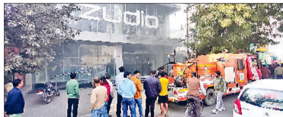
सोनीपत। शोरूम के बाहर इकट्ठा हुई लोगों की भीड़।